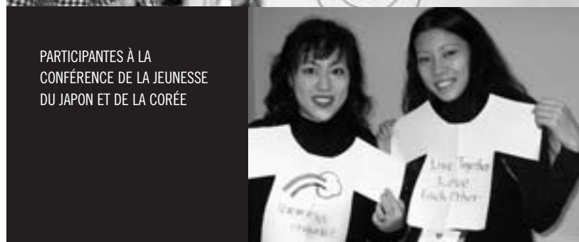
PARTICIPANTES À LA CONFÉRENCE DE LA JEUNESSE DU JAPON ET DE LA CORÉE