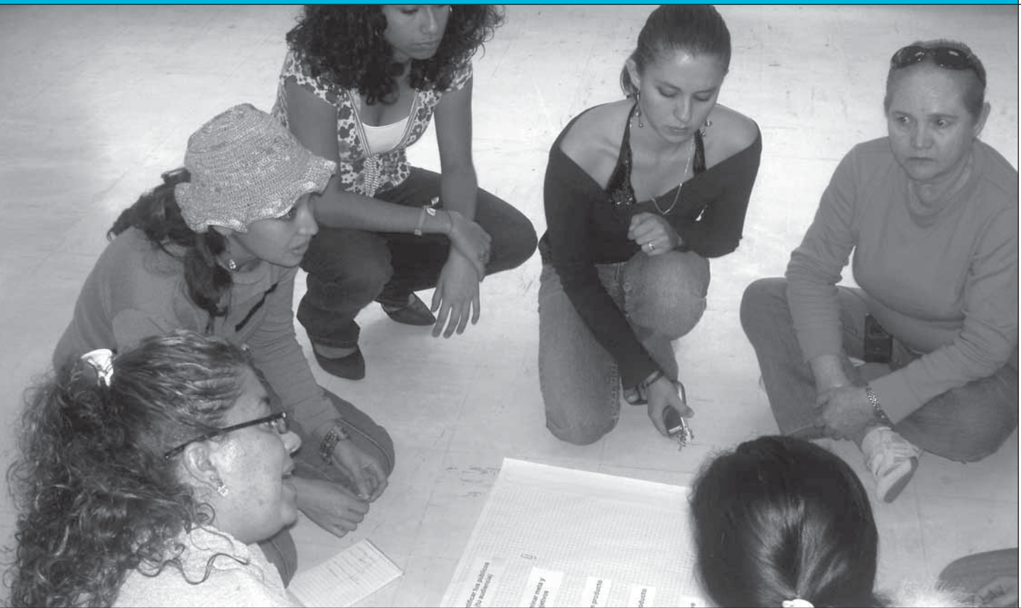
LA YWCA de Naucalpan, Méjico lleva a cabo talleres atractivos para la juventud a fin de capacitar a las jóvenes con métodos de prevención del VIH.