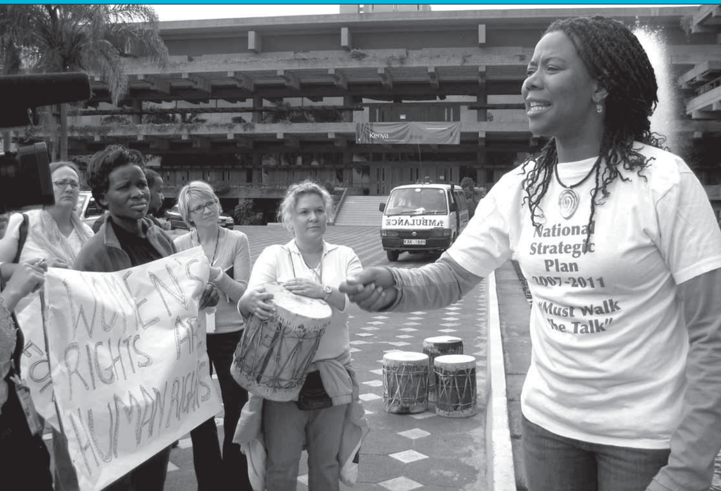
Mujeres participan en una marcha pacífica durante la Cumbre Internacional de Mujeres sobre el liderazgo femenino y VIH y SIDA, Nairobi, Kenia.