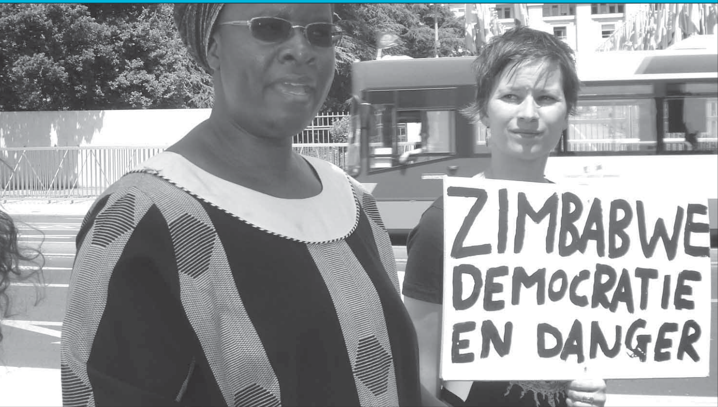
Al profundizarse la crisis política en Zimbabwe, mujeres y niñas siguen siendo las más afectadas por la violencia y la pobreza.

del sitio 'Nuestras Historias y Heroínas'. Las jóvenes que participaron en el Foro de Jóvenes durante el Consejo de la YWCA Mundial en 2007 firmaron como miembros piloto de iAIDS.org. Únase en línea hoy mismo-visite iAIDS.org, cree una cuenta y un perfil, y disfrute el sitio. Explore las contribuciones hechas por jóvenes de todo el mundo, comparta su experiencia, visualice y cargue fotos.