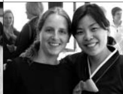
YOUNG WOMEN FROM THE YWCA GLOBAL MOVEMENT.